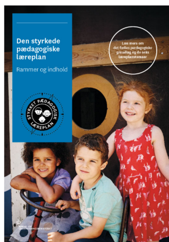
Den styrkede pædagogiske læreplan, Rammer og indhold

Inden for de krav, der følger af dagtilbudsloven, er det op til jer at beslutte, hvordan I konkret vil arbejde med den pædagogiske læreplan. Jeres læreplan skal være et dynamisk og meningsfuldt dokument, som peger fremad, og som I kan bruge aktivt i den løbende udvikling af den pædagogiske kvalitet og jeres pædagogiske praksis.